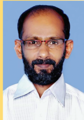
ബി. ഷാജഹാൻ (പ്രസിഡന്റ്)